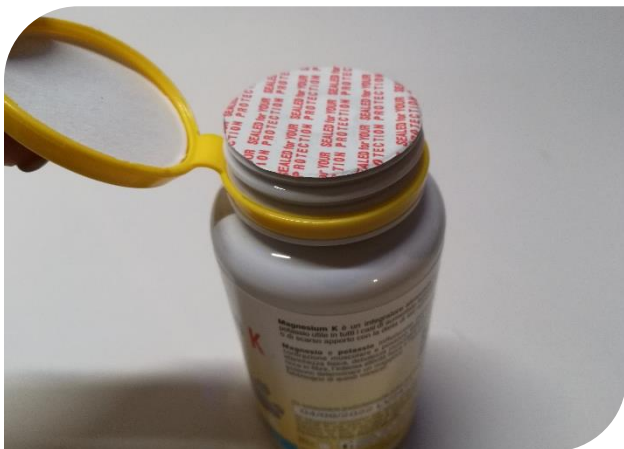
Sigillo di protezione sottotappo